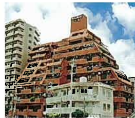
ライオンズマンション久米(平成元年)

ファイン当蔵マンション ラフィネ・ヌーベル安里 サントピア石嶺 ライオンズマンション壺川第3 サントピア港川 ライオンズマンション城間第2 サンハイツ松山マンション ラフィネ・ヌーベル真志喜第2 ラフィネ・ヌーベル宮城 サントピア港川2号棟 サントピア泊1丁目 サントピア久米 ライオンズプラザ壺川 コートヴィレッジ攻志 サントピア安里 クレスト壺川中公園 ローズマンション牧港 サントピアおもろまち 沖縄振興開発金融公庫本店ビル 県営古波蔵第3団地1号棟第2工区 ライオンズマンション新都心