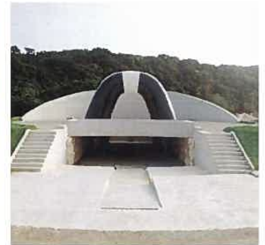
平和記念公園彫像整備工事