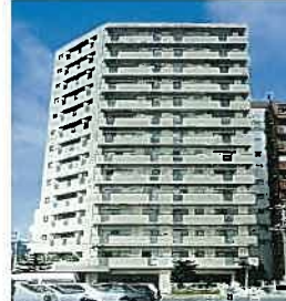
ファミール久米(平成9年)