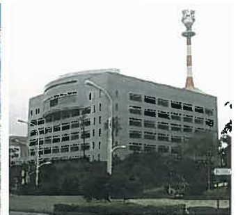
沖縄県警察棟(平成5年)