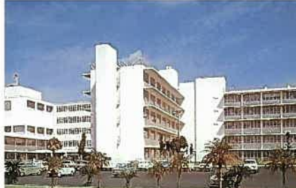
米国陸軍病院(昭和34年)