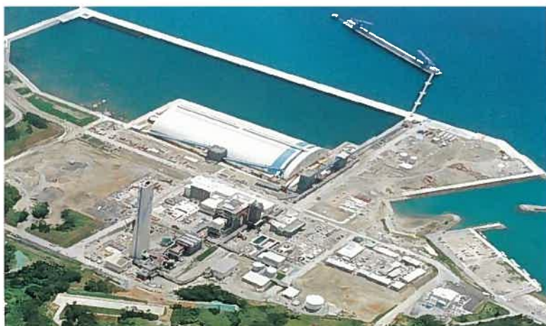
金武プロジェクト全景