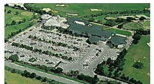
那覇ゴルフ倶楽部