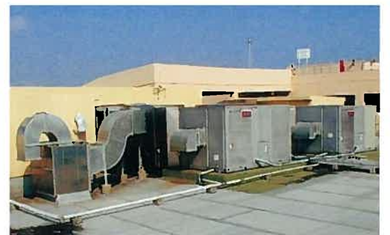
ミハマセブンプレックス空調設備