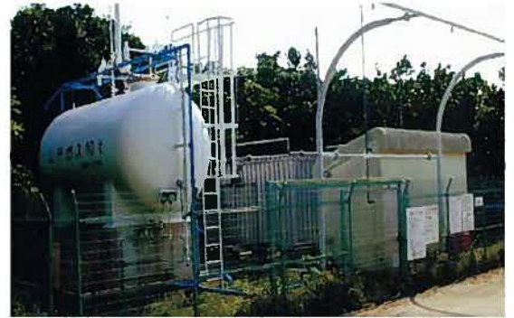
読谷リゾートLPガス供給施設