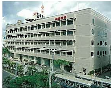
沖縄銀行本店(昭和58年)