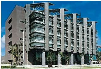
沖縄振興開発金融公庫本店(平成12年)