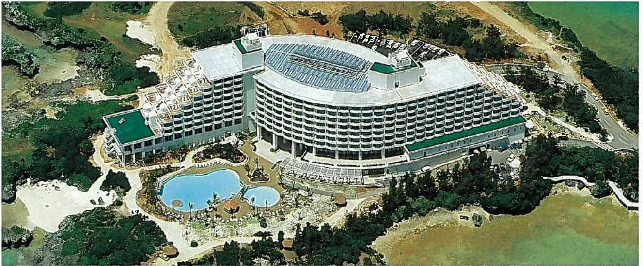
万座ビーチリゾートホテル(昭和58年)