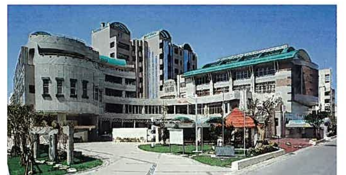
沖縄県自治研修所及び女性総合センター(平成8年)