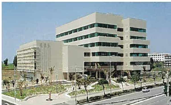
沖縄産業振興創業支援センター(平成13年)