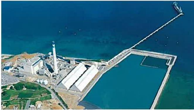
具志川火力發電所(平成7年)

現在では、より安全で高い効率を強られる石油プラントや發電所を含め、公害防止関連施設の設計・施工にいたるまで施工範囲は広く、高い信頼を得ています。