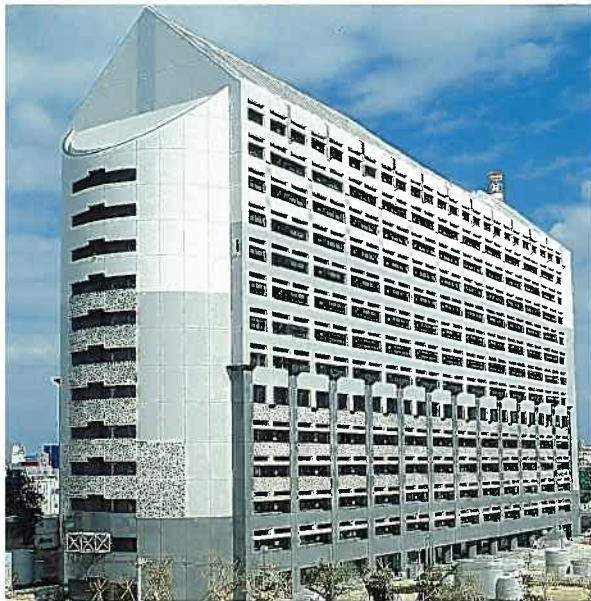
沖縄県庁舎行政棟(平成2年)