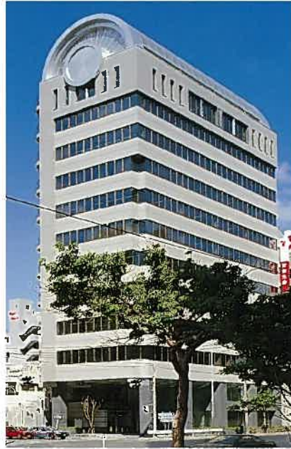
安田生命那覇ビル(平成3年)