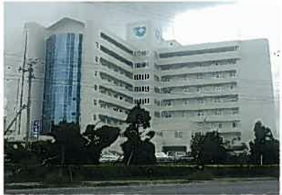
ハートライフ病院(平成2年)