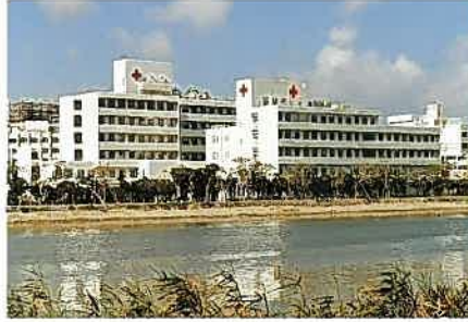
沖縄赤十字病院(昭和59年)