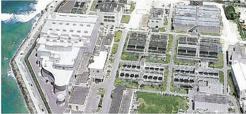
沖縄県海水淡水化施設

サミットにおいては、その主会場の基盤整備工事にて、持てる技術力を結集し、隣接海浜の環境保護対策をも講じつつ、短期間で完成しました。これからも、環境にやさしく自然との共生を図り、未来の子供達に自信をもって継承出来る社会的資産を構築する為、品質と環境マネジメントの向上に努めていきます。