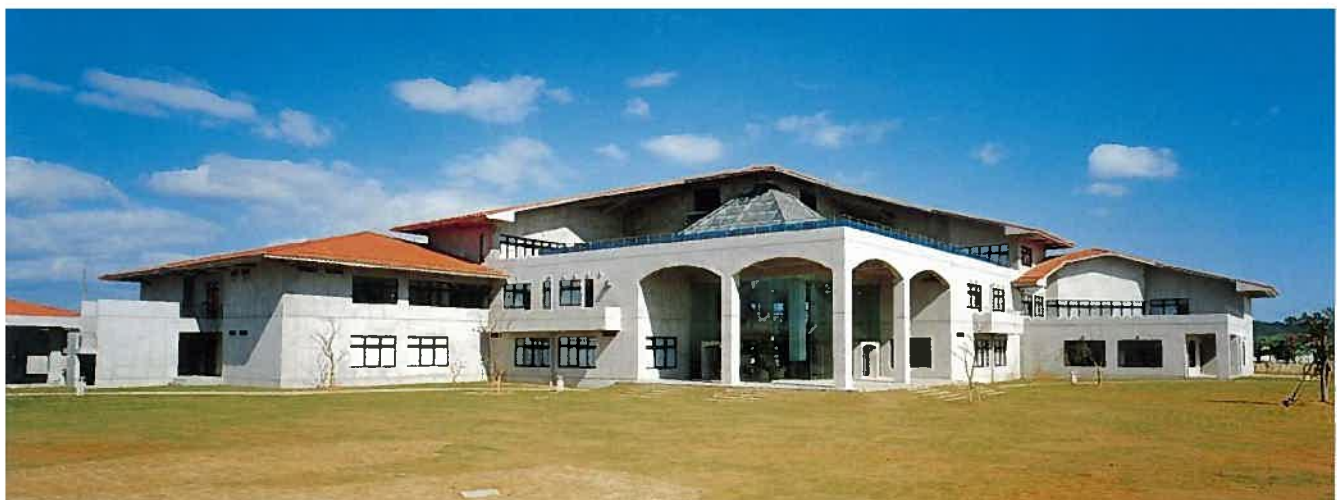
トロピカルテクノセンター(平成5年)