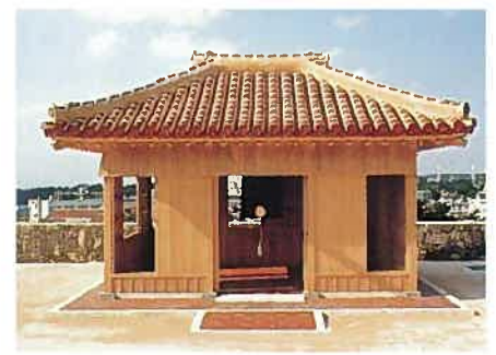
首里城万国津梁の鐘(平成12年)