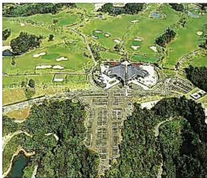
福岡レイクサイドカントリー