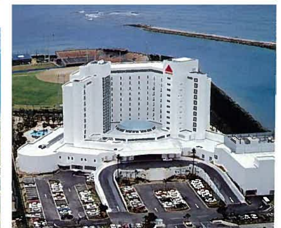
ラグナガーデンホテル(平成4年)