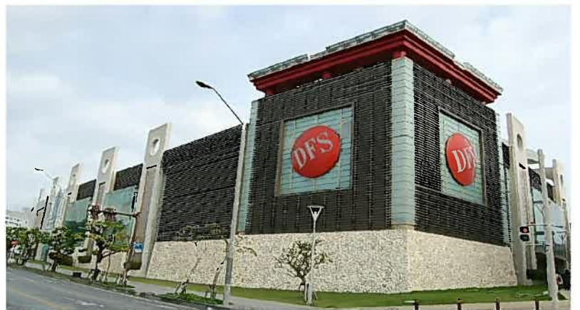
DFSギャラリア沖縄(平成19年)