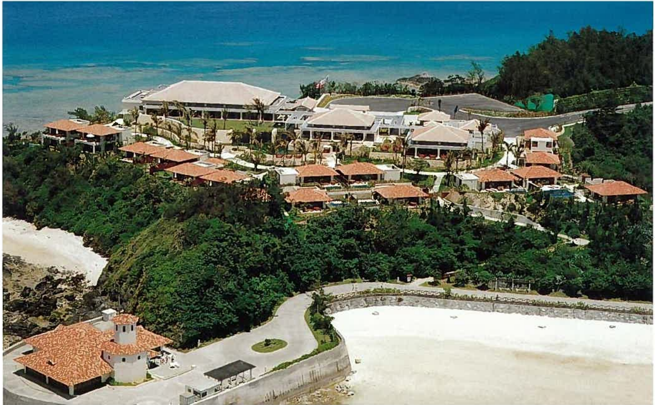
万国津梁館(平成12年)