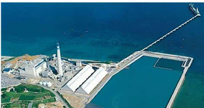
具志川火力発電所