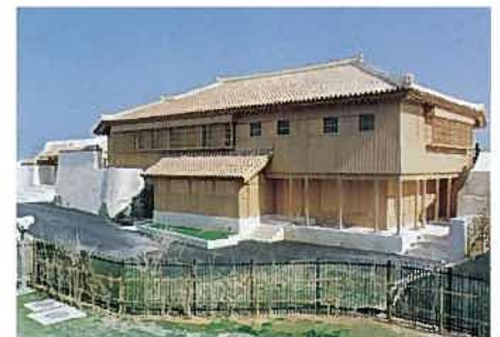
首里城二階殿(平成12年)