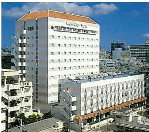
沖縄ワシントンホテル(昭和63年)