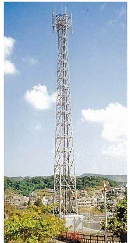
南風原本部無線基地局J-Phon