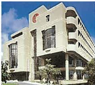
琉球銀行健保会館(昭和57年)