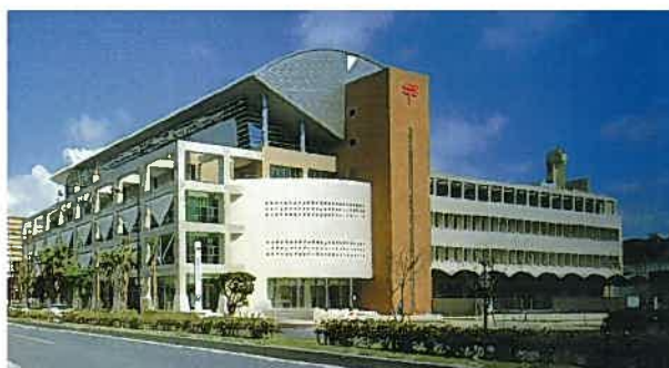
中央郵便局(平成9年)