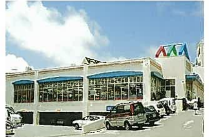
りゅうほう国場店(平成10年)