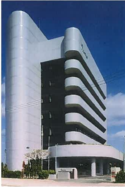
りゅうせき本社ビル(平成3年)