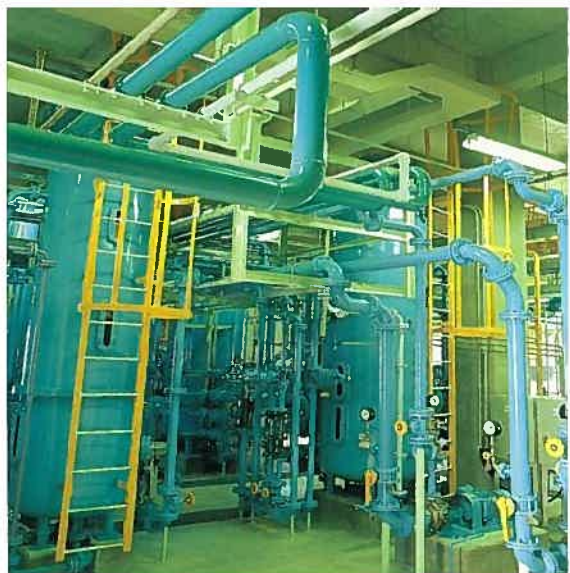
石川石炭火力發電所(純水製造装置)