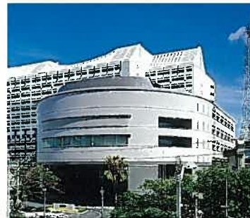
沖縄県議会議棟(平成4年)