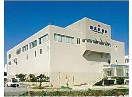
琉球新報製作センター(平成11年)