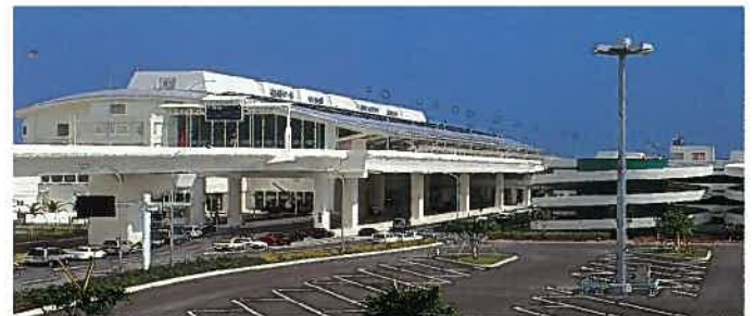
新那覇空港ターミナルビル(平成10年)