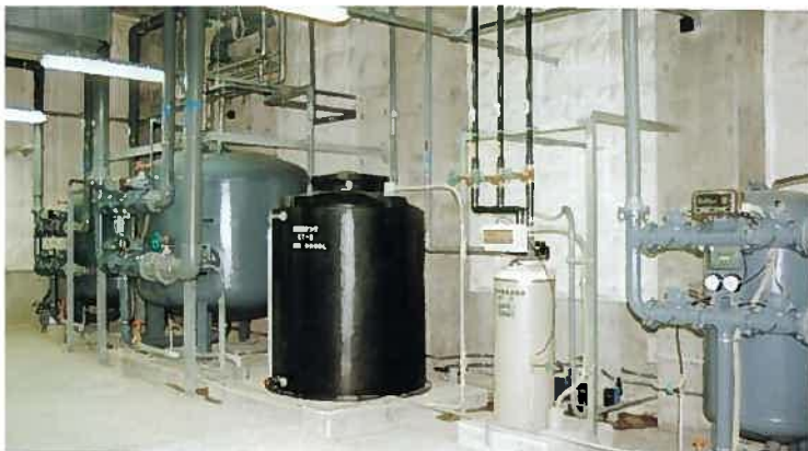
ザ・ブセナテラスプール施設(平成9年)