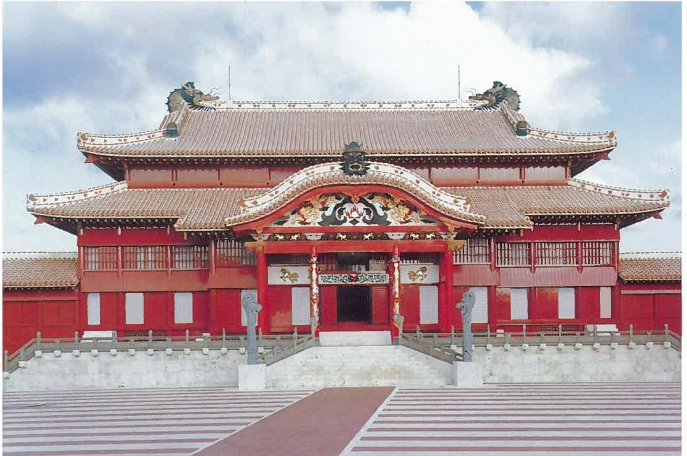
首里城正殿(平成4年)