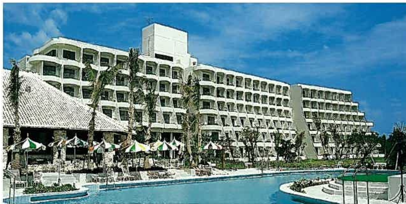
宮古島東急リゾートホテル(平成5年)