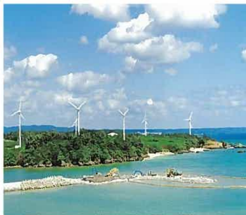
宜野座村風力発電所(平成10年)