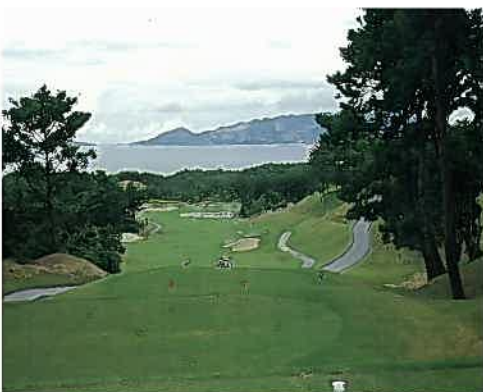
海邦カントリークラブ