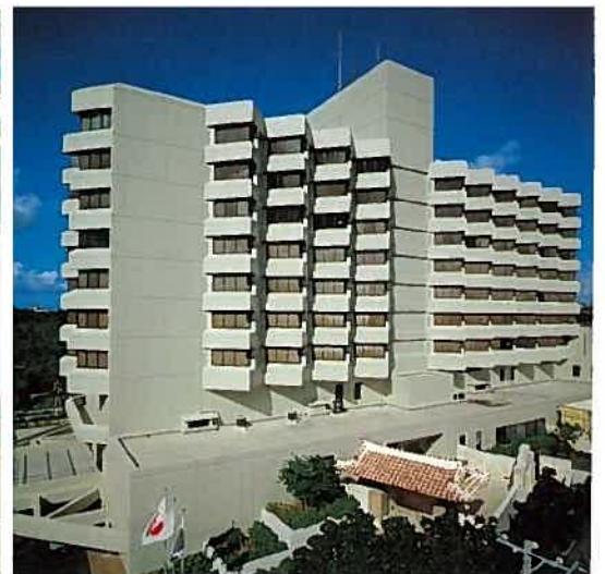
ザ・ナハテラス(平成12年)