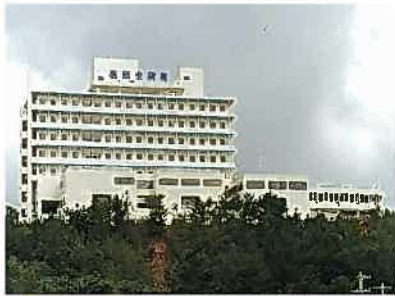
北部医師会病院(平成3年)