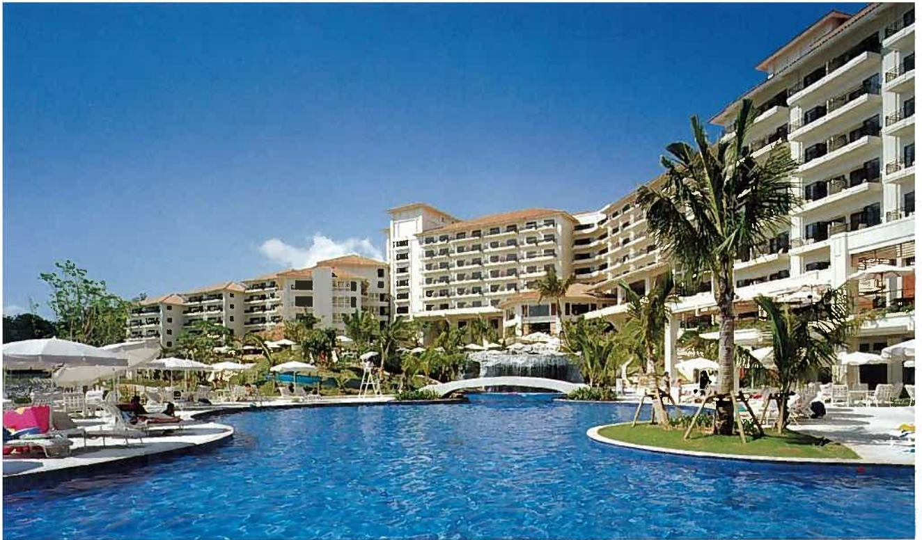
ザ・ブセナテラス(平成9年)