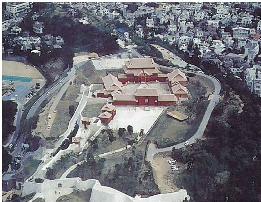
首里城正殿と広福門(平成4年)