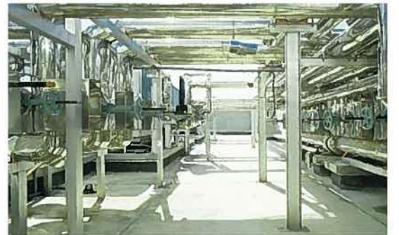
元ホテルシティコート那覇(屋上配管状況)