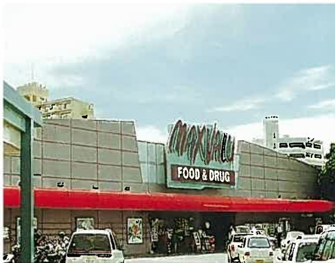
マックスバリュー(平成10年)