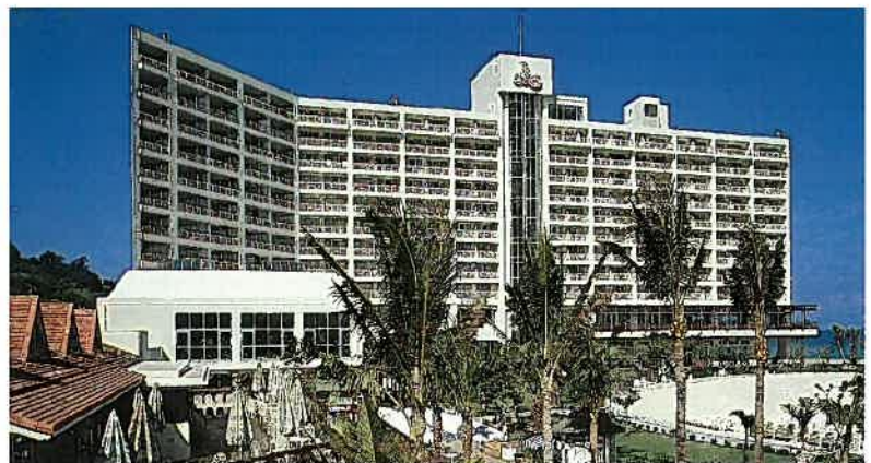
ルネッサンスリゾート・オキナワ(昭和63年)