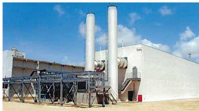
石垣第二發電所 ガスタービン(平成12年)