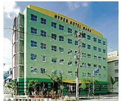
ハイパーホテル那覇(平成13年)