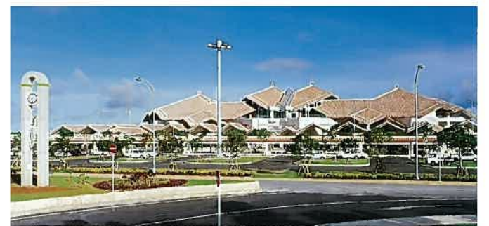
宮古島空港ターミナルビル(平成8年)