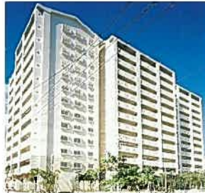
県営古波蔵第3団地(平成12年)