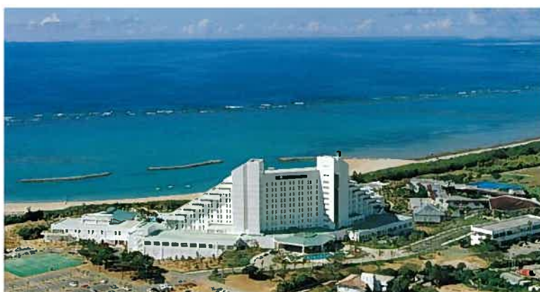
石垣ホテルサンコースト(平成10年)