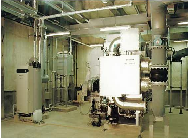
ザ・ブセナテラス機械室(平成9年)

当社の機械設備部門は、独立した専門技術集団としても評価が高く、その信頼に応えるよう、より一層の技術研究開発に努めています。また、過去の実績に基づいて海外工事に対しても意欲的に取り組み広く世界に貢献したいと考えております。