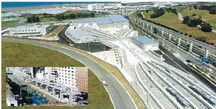
モノレール運営基地