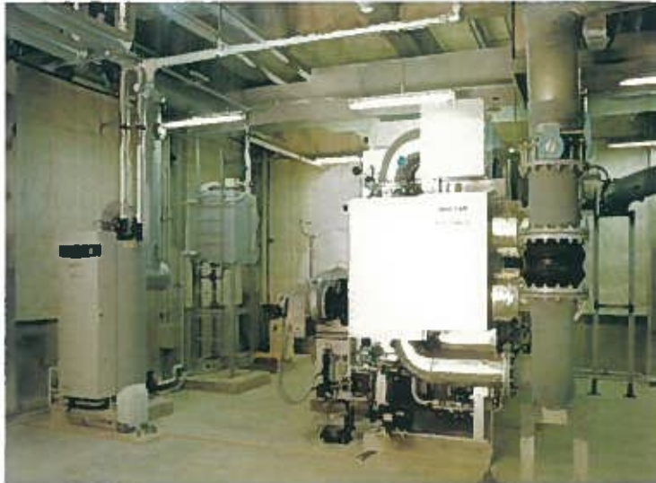
ザ・ブセナテラス機械室(平成9年)

当社の機械設備部門は、独立した専門技術集団としても評価が高く、その信頼に応えるよう、より一層の技術研究開発に努めています。また、過去の実績に基づいて海外工事に対しても意欲的に取り組み広く世界に貢献したいと考えております。