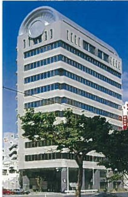
安田生命那覇ビル(平成3年)