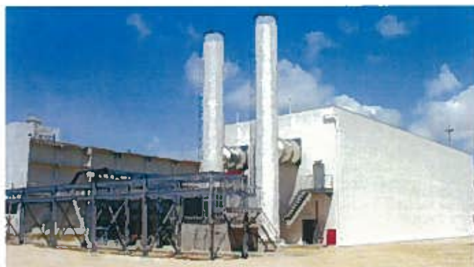
石垣第二発電所 ガスタービン(平成12年)