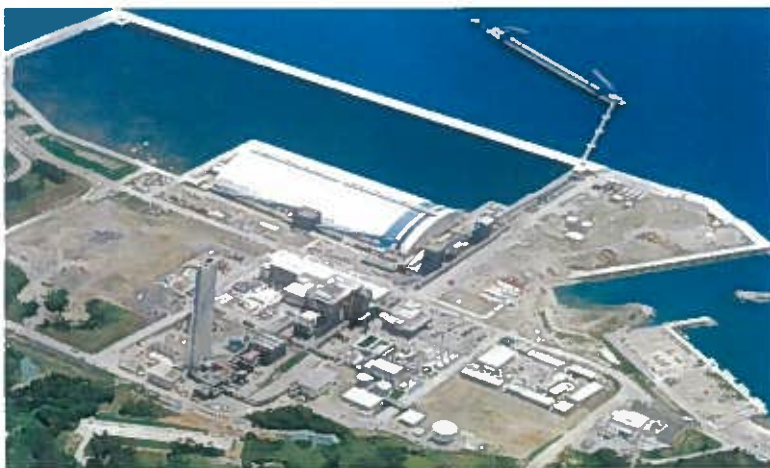
金武プロジェクト全景