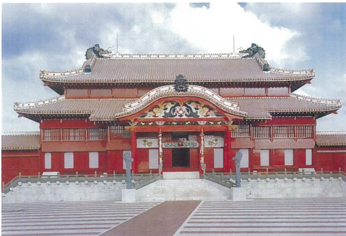
首里城正殿(平成4年)