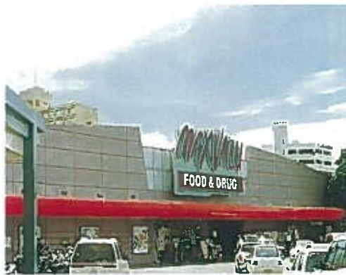
マックスバリュウ(平成10年)