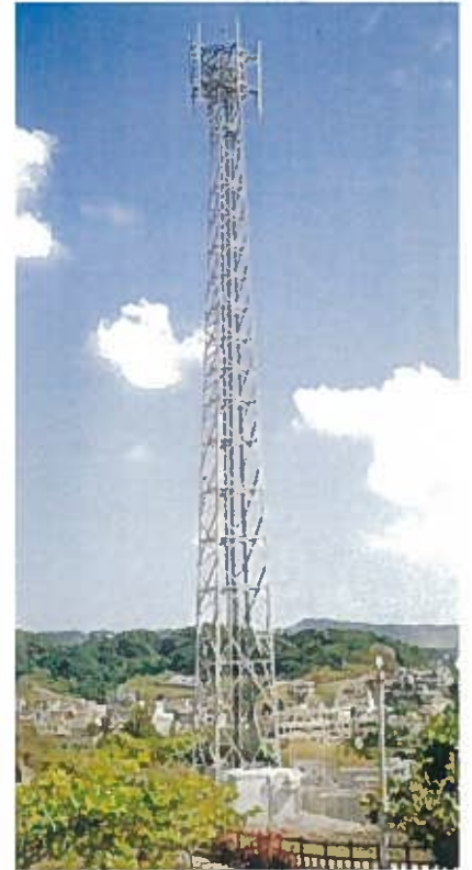
南風原本部無線基地局J-Phon