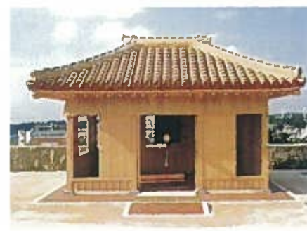
首里城万国津梁の鐘(平成12年)