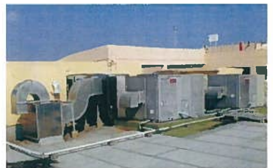
ミハマセブンプレックス空調設備