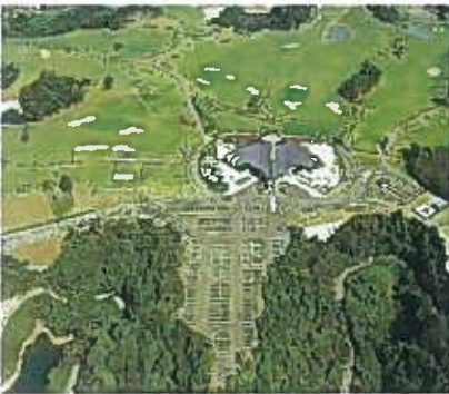
福岡レイクサイドカントリー