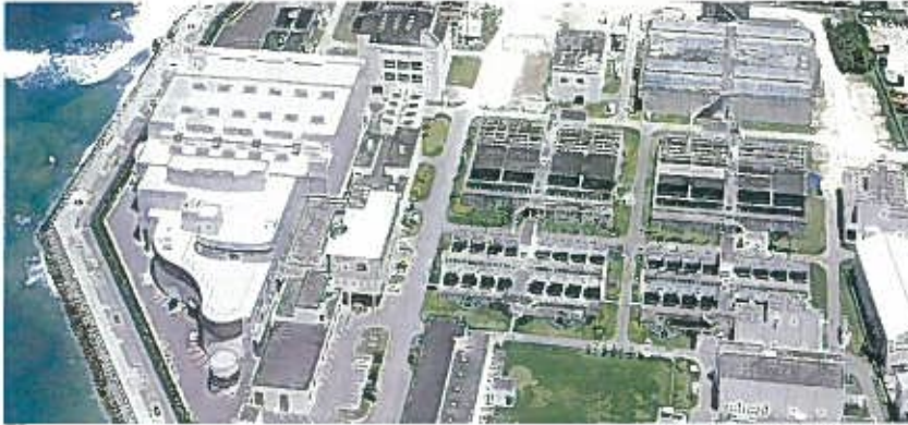
沖縄県海水淡水化施設

サミットにおいては、その主会場の基盤整備工事にて、持てる技術力を結集し、隣接海浜の環境保護対策をも講じつつ、短期間で完成しました。これからも、環境にやさしく自然との共生を図り、未来の子供達に自信をもって継承出来る社会的資産を構築する為、品質と環境マネジメントの向上に努めていきます。