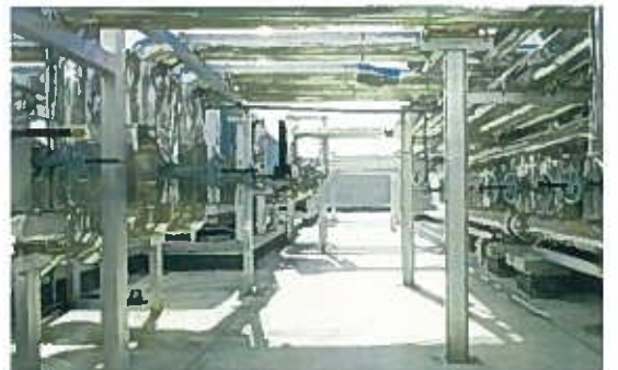
元ホテルシティコート那覇(屋上配管状況)