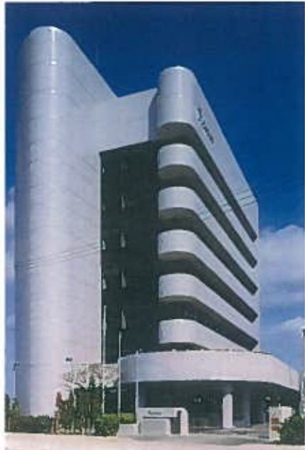
りゅうせき本社ビル(平成3年)