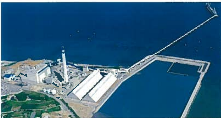
具志川火力発電所