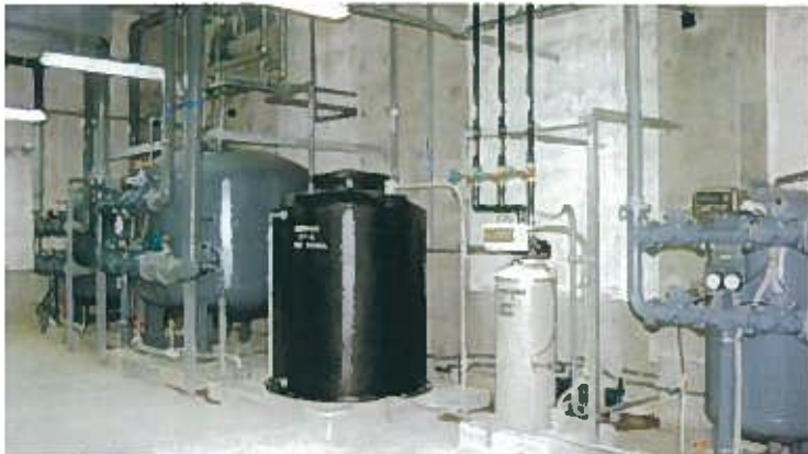
ザ・ブセナテラスプール施設(平成9年)