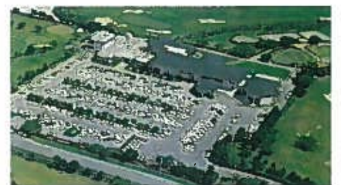
那覇ゴルフ倶楽部