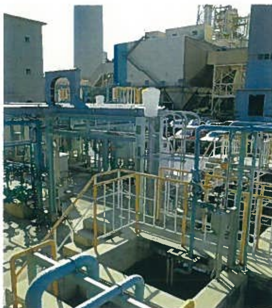
石川石炭火力発電所(回収水処理装置)