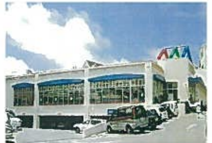
りうぼう国場店(平成10年)