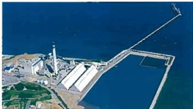
具志川火力発電所(平成7年)

現在では、より安全で高い効率を強いられる石油プラントや発電所を含め、公害防止関連施設の設計・施工にいたるまで施工範囲は広く、高い信頼を得ています。