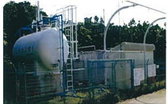
読谷リゾートLPガス供給施設