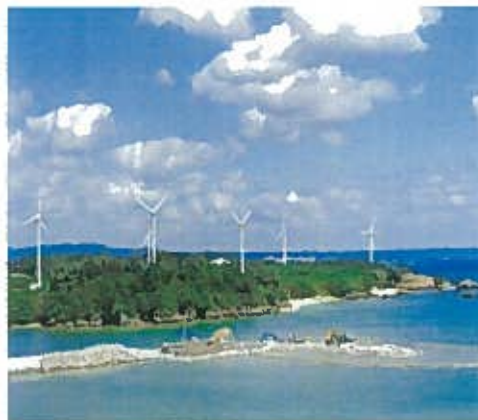
宜野座村風力発電所(平成10年)