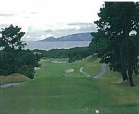
海邦カントリークラブ