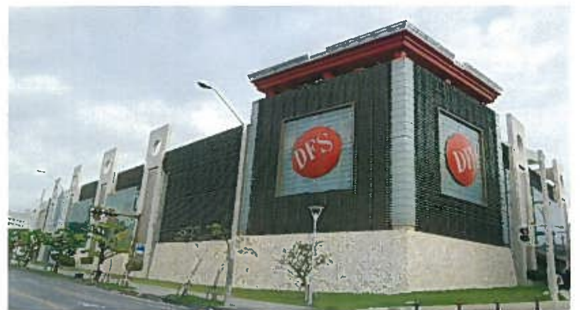
DFSギャラリー沖縄(平成19年)