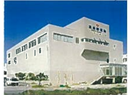
琉球新報製作センター(平成11年)