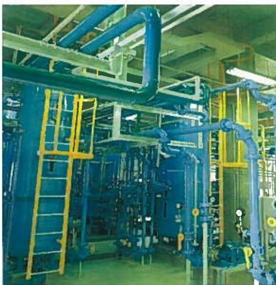
石川石炭火力発電所(純水製造装置)