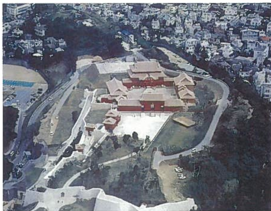
首里城正殿と広福門(平成4年)