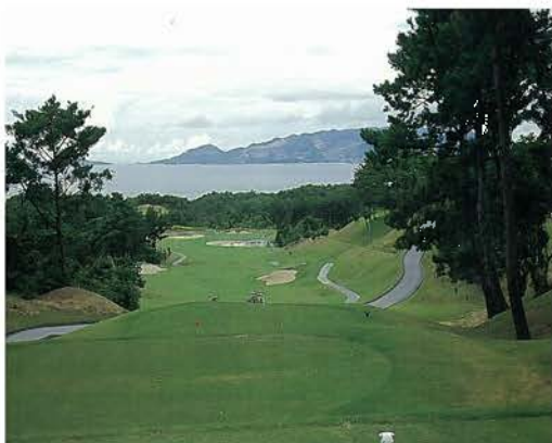
海邦カントリークラブ