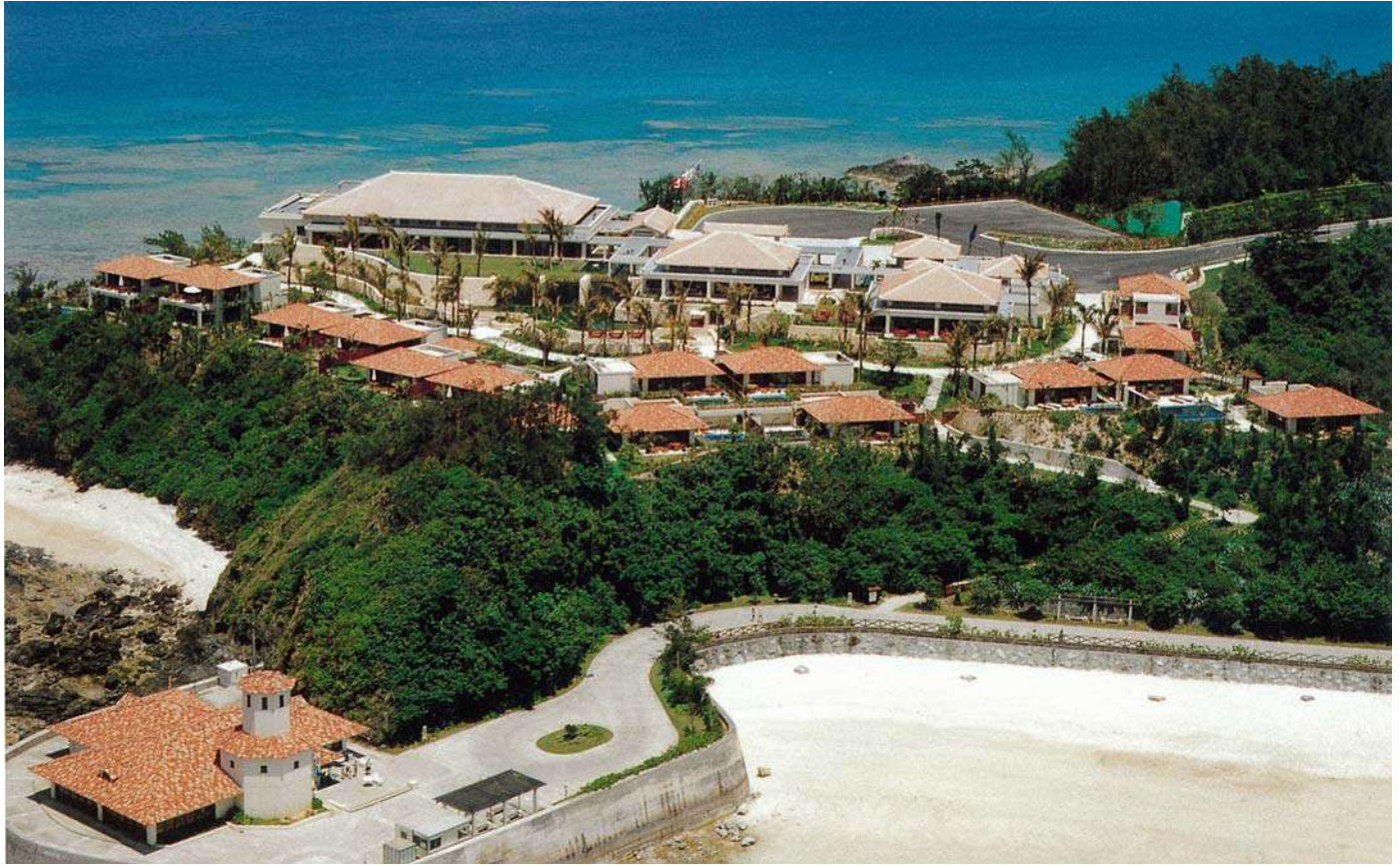
万国津梁館(平成12年)