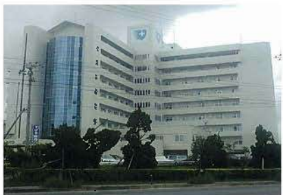
ハートライフ病院(平成2年)