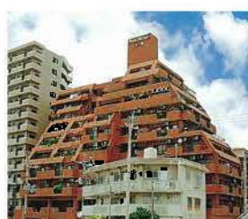
ライオンズマンション久米(平成元年)