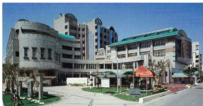
沖縄県自治研修所及び女性総合センター(平成8年)