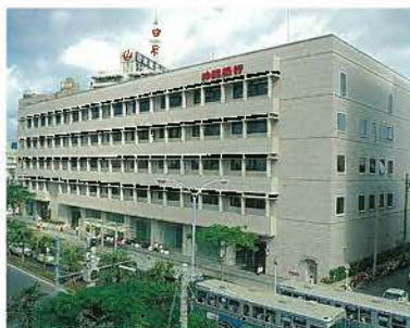
沖縄銀行本店(昭和58年)