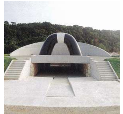
平和記念公園彫像整備工事