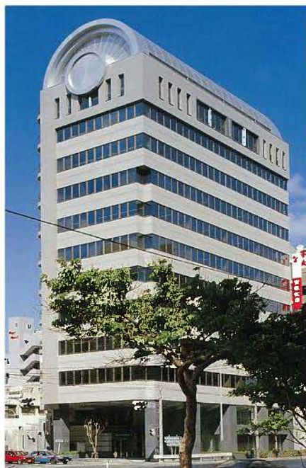
安田生命那覇ビル(平成3年)