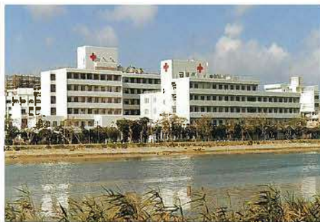
沖縄赤十字病院(昭和59年)