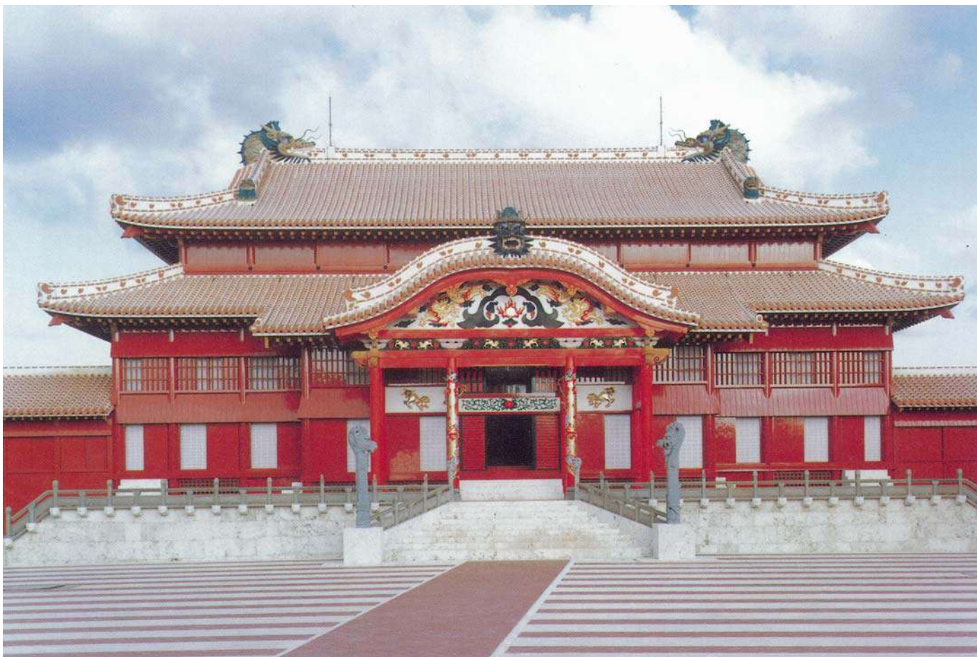
首里城正殿(平成4年)