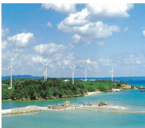
宜野座村風力発電所(平成10年)