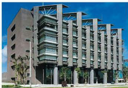
沖縄振興開発金融公庫本店(平成12年)