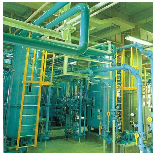
石川石炭火力発電所(純水製造装置)