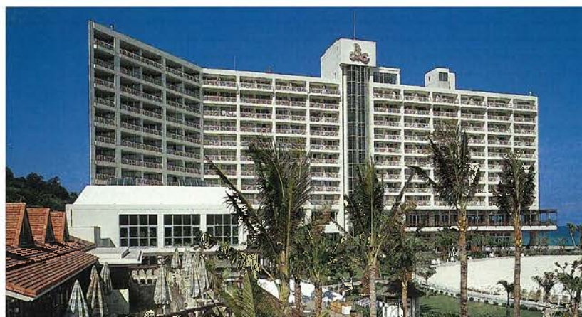
ルネッサンスリゾート・オキナワ(昭和63年)