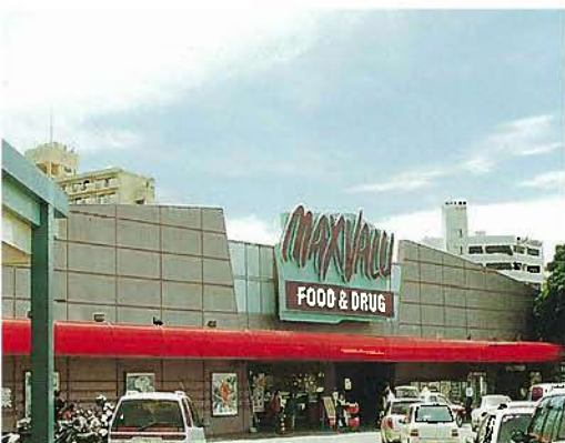
マックスバリュー(平成10年)