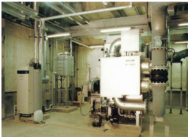
ザ・ブセナテラス機械室(平成9年)

当社の機械設備部門は、独立した専門技術集団としても評価が高く、その信頼に応えるよう、より一層の技術研究開発に努めています。また、過去の実績に基づいて海外工事に対しても意欲的に取り組み広く世界に貢献したいと考えております。