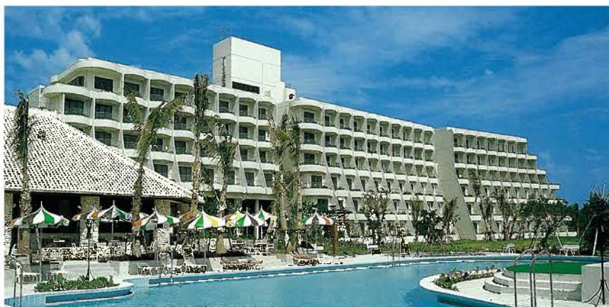
宮古島東急リゾートホテル(平成5年)