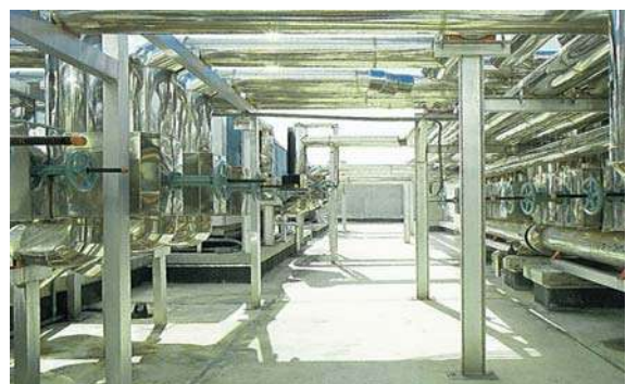
元ホテルシティーコート那覇(屋上配管状況)