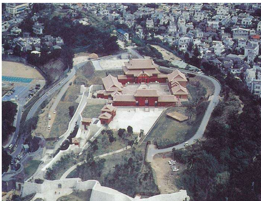
首里城正殿と広福門(平成4年)