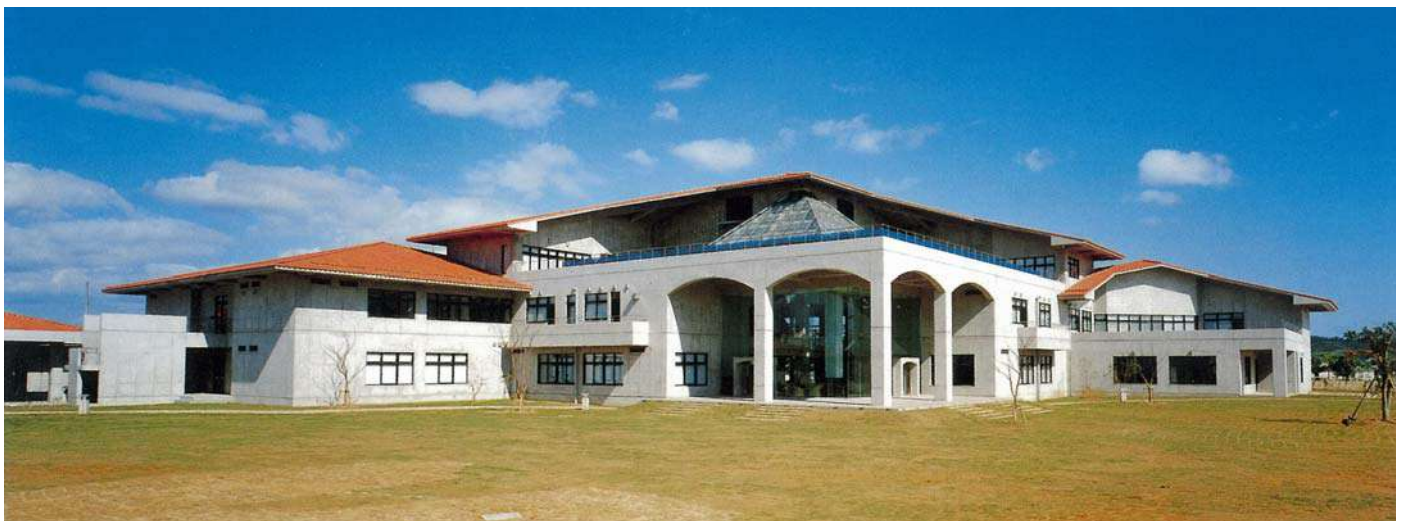
トロピカルテクノセンター(平成5年)