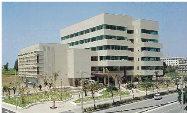
沖縄産業振興創業支援センター(平成13年)