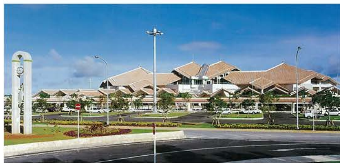
宮古島空港ターミナルビル(平成8年)