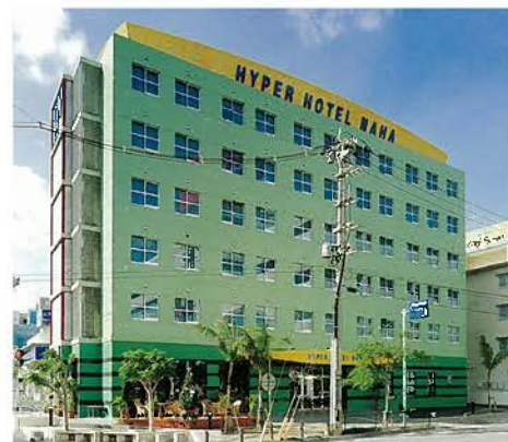
ハイパーホテル那覇(平成13年)