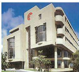
琉球銀行健保会館(昭和57年)