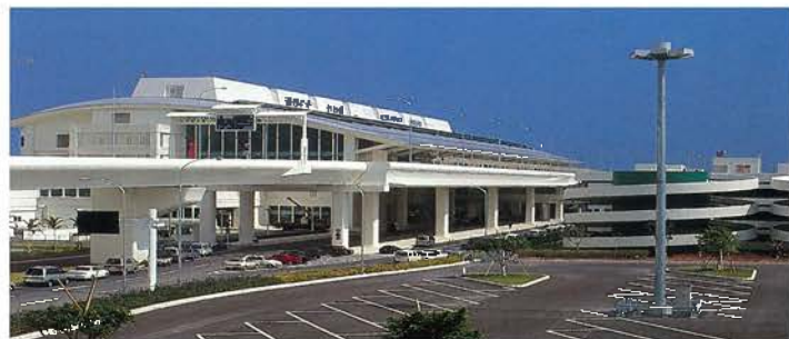
新那覇空港ターミナルビル(平成10年)