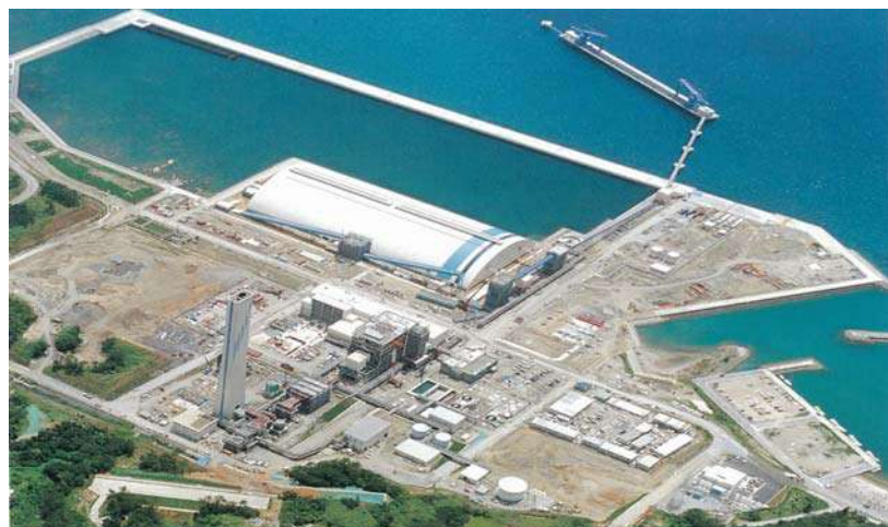
金武プロジェクト全景