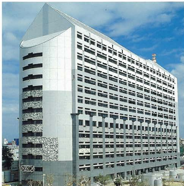
沖縄県庁舎行政棟(平成2年)