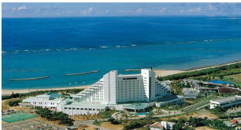
石垣ホテルサンコースト(平成10年)