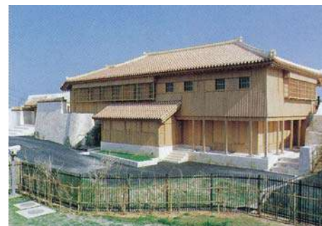
首里城二階殿(平成12年)