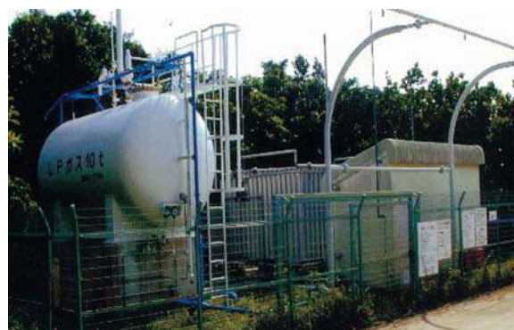
読谷リゾートLPガス供給施設