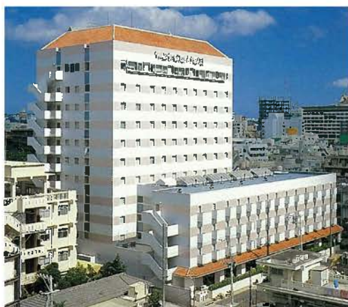
沖縄ワシントンホテル(昭和63年)