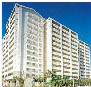
県営古波蔵第3団地(平成12年)