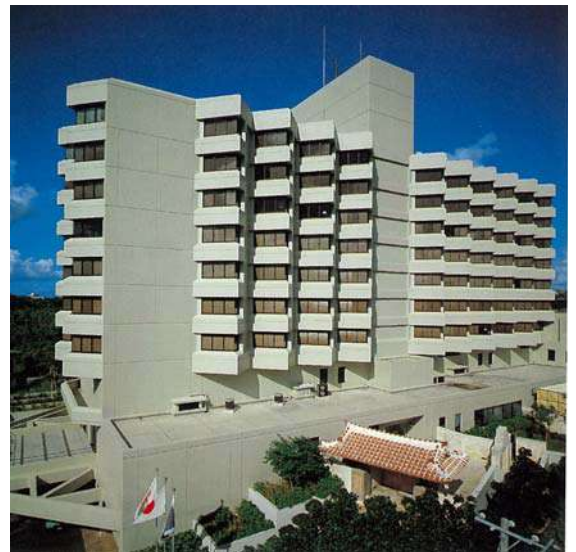
ザ・ナハテラス(平成12年)