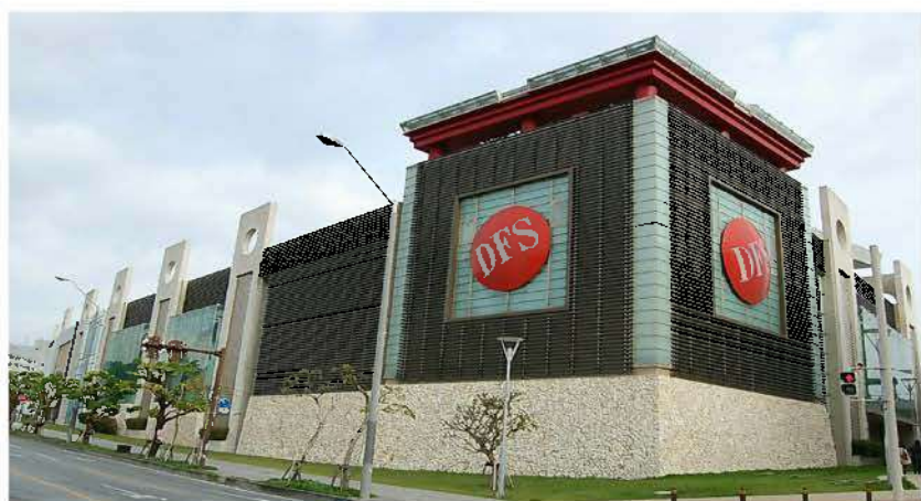
DFSギャラリー沖縄(平成19年)