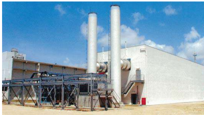
石垣第二発電所 ガスタービン(平成12年)