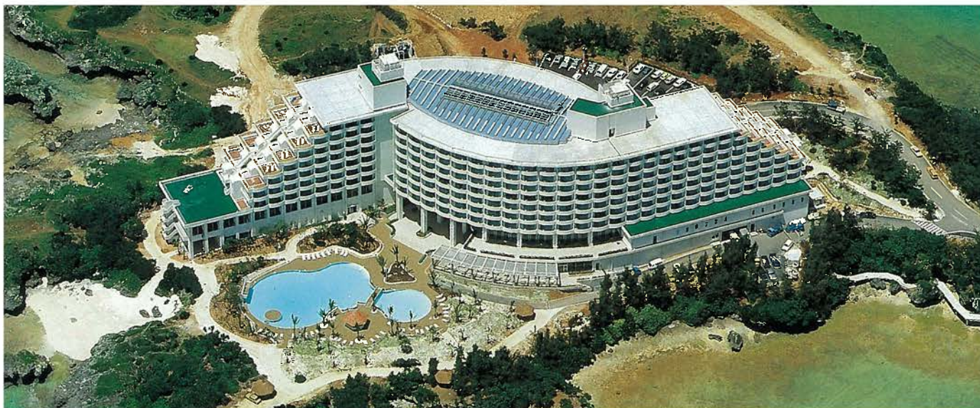
万座ビーチリゾートホテル(昭和58年)