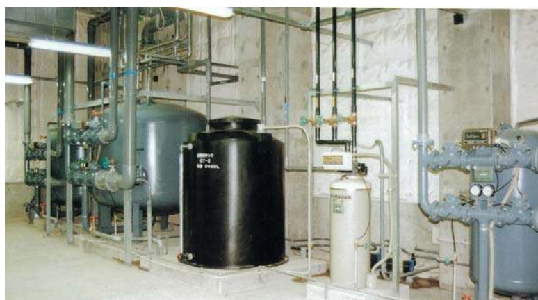
ザ・ブセナテラスプール施設(平成9年)