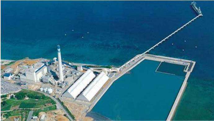
具志川火力発電所(平成7年)

現在では、より安全で高い効率を強いられる石油プラントや発電所を含め、公害防止関連施設の設計・施工にいたるまで施工範囲は広く、高い信頼を得ています。