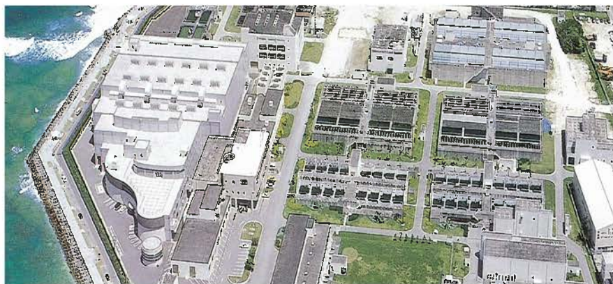
沖縄県海水淡水化施設

これからも、環境にやさしく自然との共生を図り、未来の子供達に自信をもって継承出来る社会的資産を構築する為、品質と環境マネジメントの向上に努めていきます。