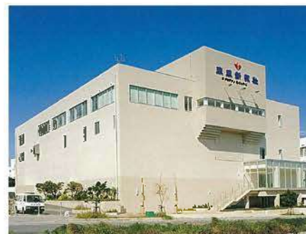
琉球新報製作センター(平成11年)