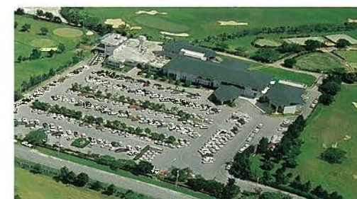
那覇ゴルフ倶楽部