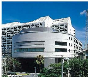
沖縄県議会棟(平成4年)