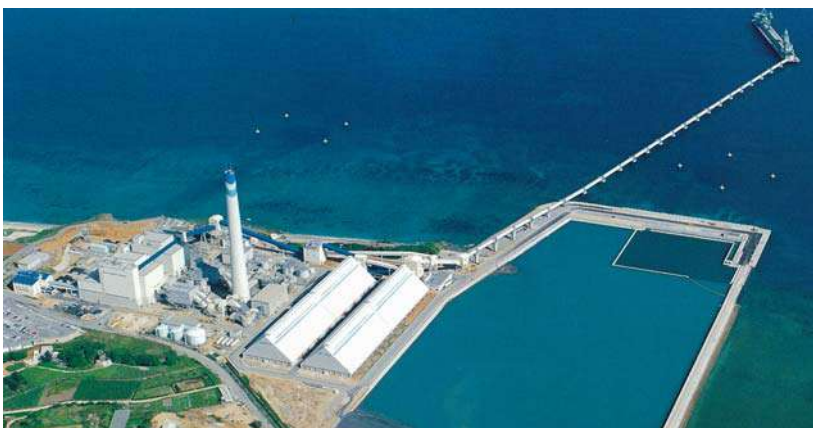
具志川火力発電所