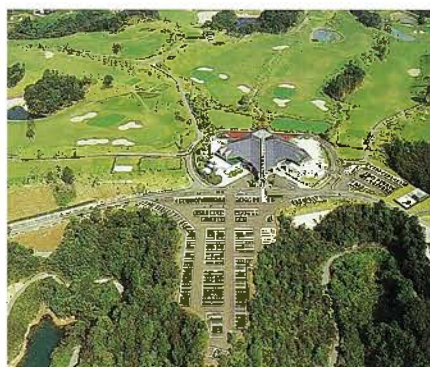
福岡レイクサイドカントリー