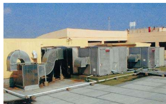
ミハマセブンプレックス空調設備