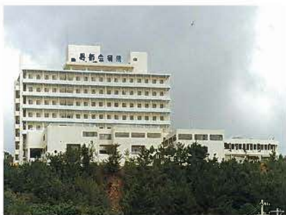
北部医師会病院(平成3年)