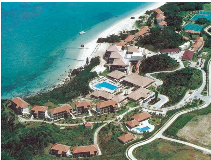
クラブメッドカピラ(平成11年)