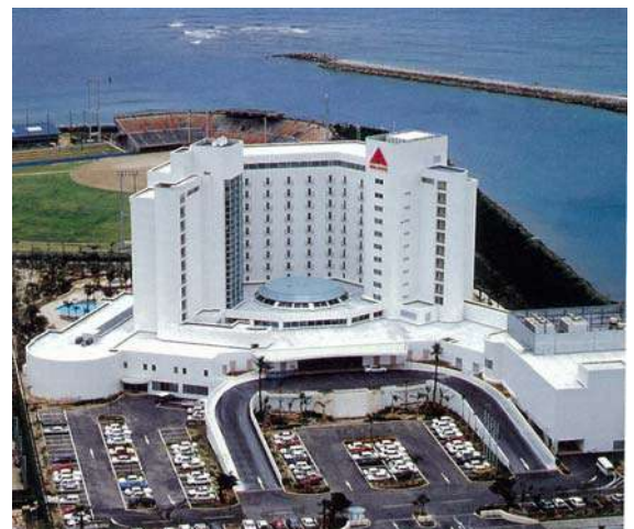
ラグナガーデンホテル(平成4年)