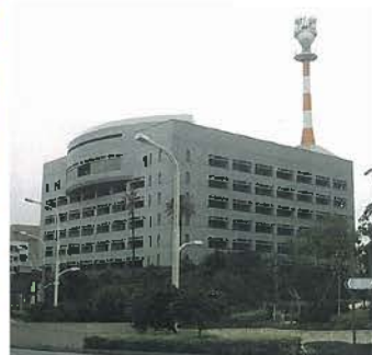
沖縄県警察棟(平成5年)