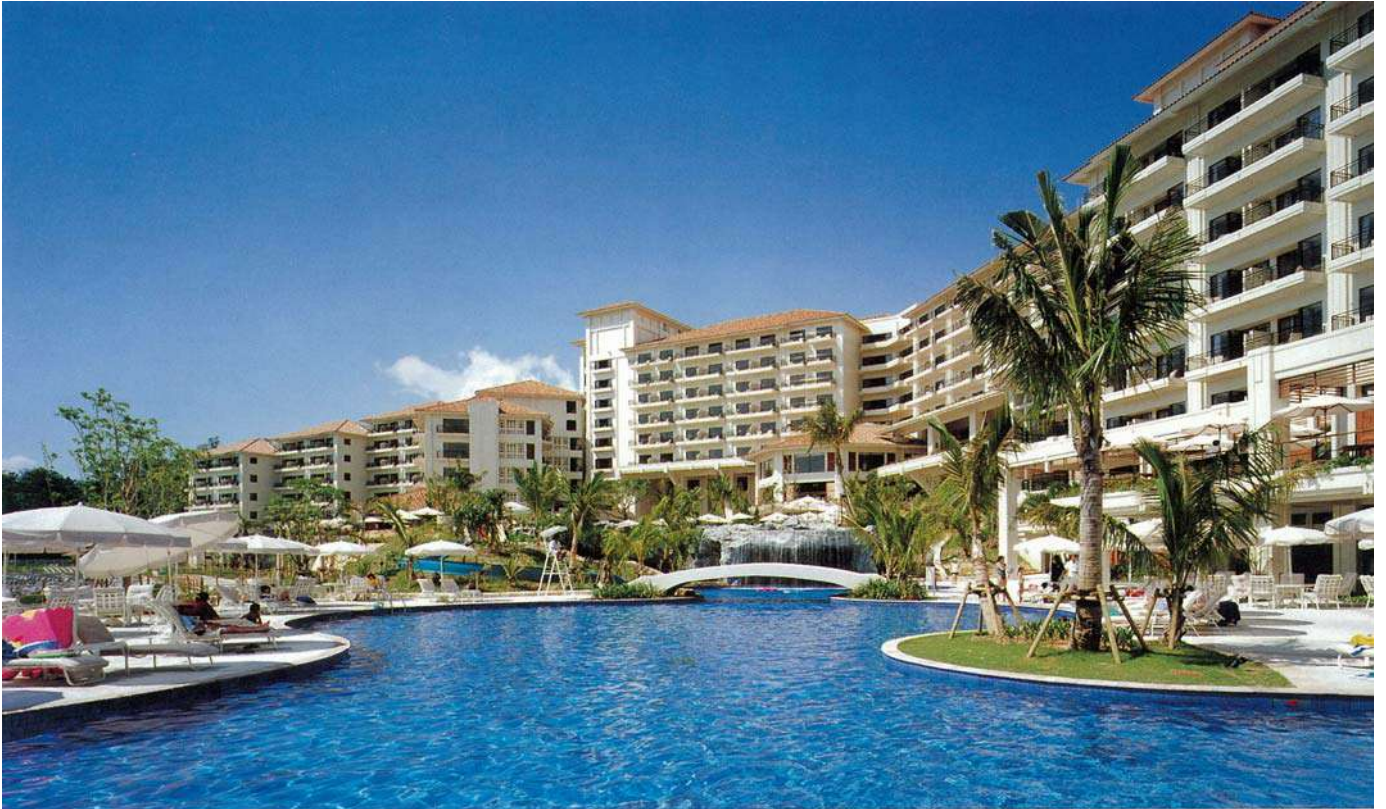
ザ・ブセナテラス(平成9年)