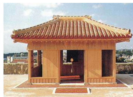
首里城万国津梁の鐘(平成12年)