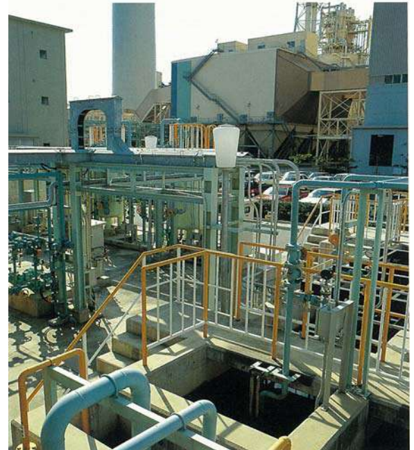
石川石炭火力発電所(回収水処理装置)