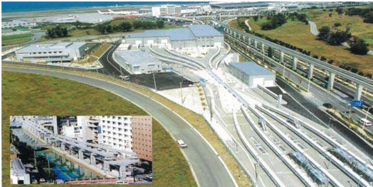
モノレール運営基地