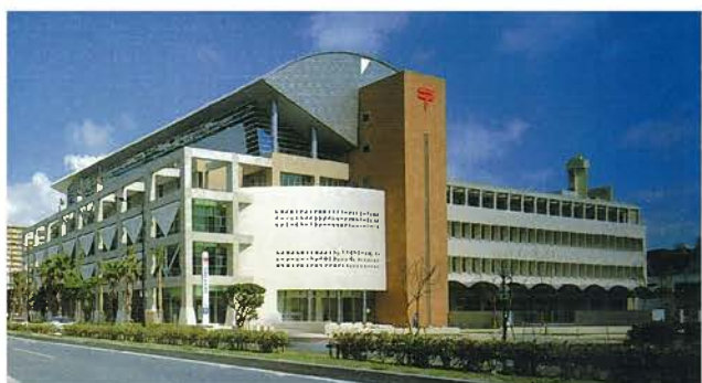
中央郵便局(平成9年)