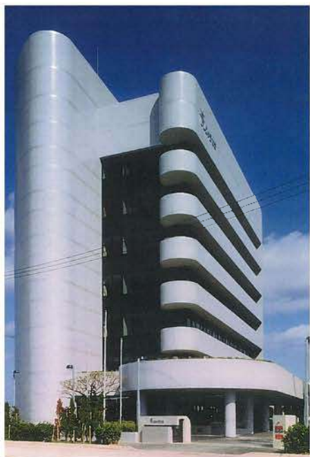
りゅうせき本社ビル(平成3年)