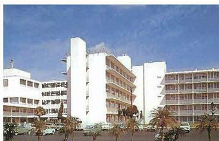
米国防軍病院(昭和34年)