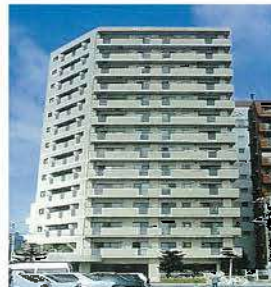
ファミール久米(平成9年)