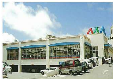
りゅうぼう国場店(平成10年)